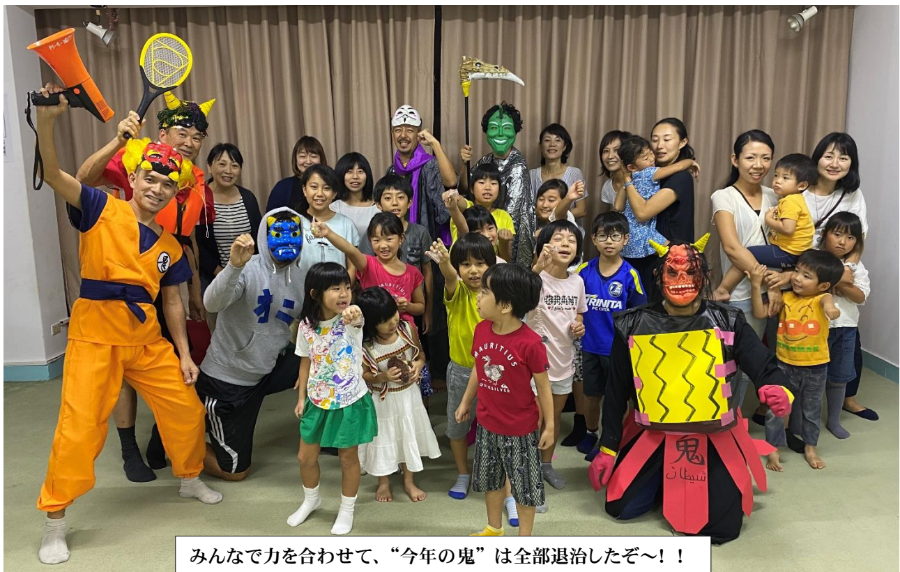
みんなで力を合わせて、“今年の鬼”は全部退治したぞ～!!