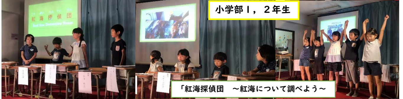
「紅海探偵団 ～紅海について調べよう～」