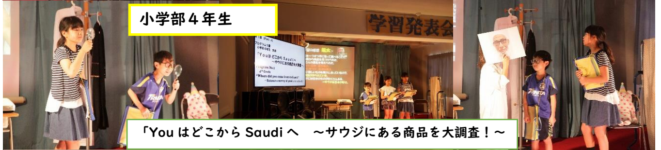
「Youはどこから Saudiへ ～サウジにある商品を大調査!～」