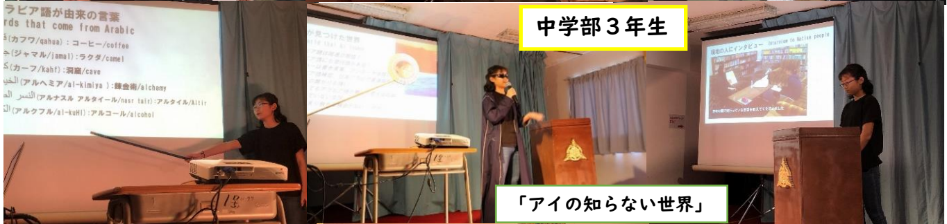
「アイの知らない世界」