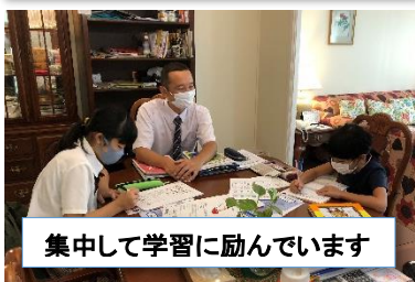
集中して学習に励んでいます