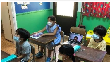
やっぱりこの机とイスがいいな！