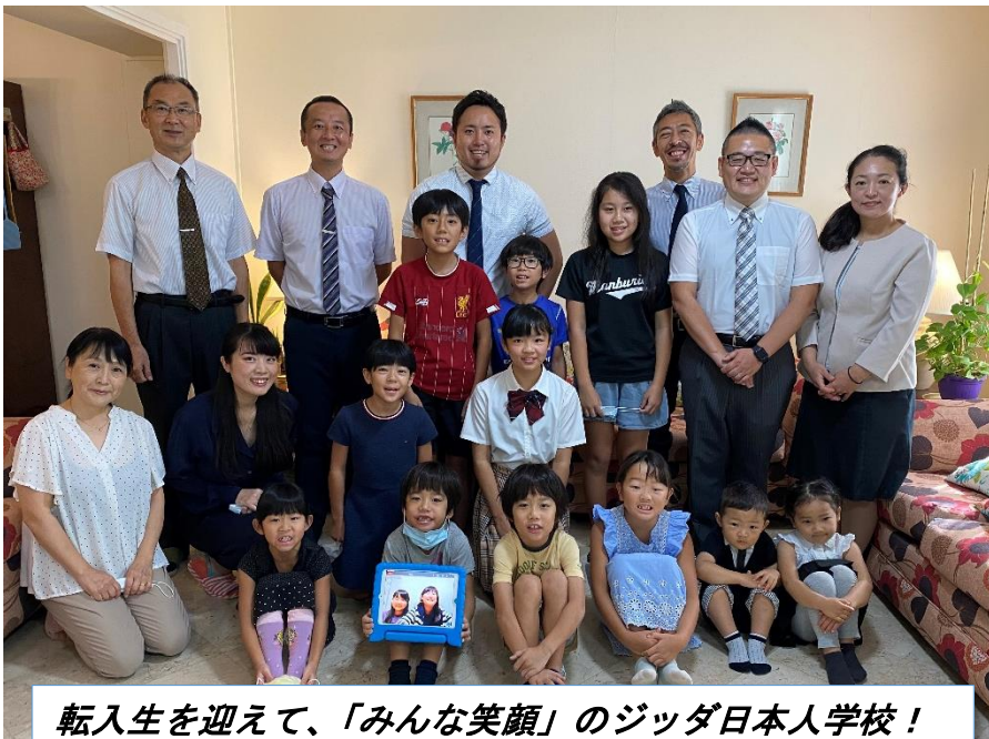
転入生を迎えて、「みんな笑顔」のジッダ日本人学校！

前期に引き続き、MBコンパウンド内にて「分散・分室学習」を行うこととなりますが、関係する皆様のご理解とご支援により、さらに充実した学習環境の下で教育活動ができることは大変ありがたいことです。これからも「子どもの幸せ、家族の喜び」につながる教育活動に全力で取り組んで参りますので、引き続きご支援・ご協力を賜りますようお願いいたします。