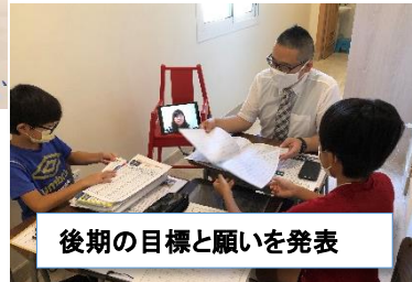
後期の目標と願いを発表