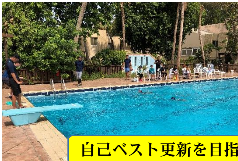
自己ベスト更新を目指して力泳する子どもたち

先週の9日(金)には、在ジッダ日本国総領事館総領事・新村様ご夫妻、学校運営委員長・植竹様ご夫妻をはじめ保護者の皆様にご参加いただきまして水泳記録会を行いました。昨年度に引き続き学校での水泳学習ができませんでしたが、今年の4月中旬より3ヶ月余に渡りMBの6番プールにて週3時間の水泳学習に取り組んできました。この間子どもたちは、「挑戦する勇気」と「感謝する気持ち」を常に忘れずに、自分が定めた明確なめあてや目標に向けて、一生懸命水泳学習に励んできました。常に自分の無限の可能性を信じて、最後の最後まで自己ベスト更新を目指して全力で取り組む子どもたちの姿は本当に立派でした。一人ひとりがキラキラと輝いていました！当日のご参観ならびにご声援、誠にありがとうございました。