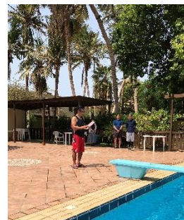
講評：植竹委員長様より