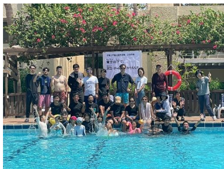
みんな笑顔で 記念撮影

前号の水泳大会特集でお話ししましたが、水泳大会の3つの目標 ①日頃の授業の成果を発表する。②自分の役割を果たし、協力して行事を作る。③家族や日本人会の人と交流を深める。子どもたちの感想からも、3つとも目標を達成できたと考えています。また、ご参加していただいた方には、日本人学校の学校行事への取組がご理解していただけたかと思ひます。日本人学校