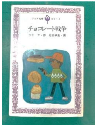
思い出の大石真作 チョコレート戦争

読書は、①会話力や文章力の向上、②ボキャブラリーが増える、③教養や知識が身に付く、④想像力が豊かになるなど、いろいろな効果が期待できます。また、一つのことに集中するので、ストレス解消にもなります。