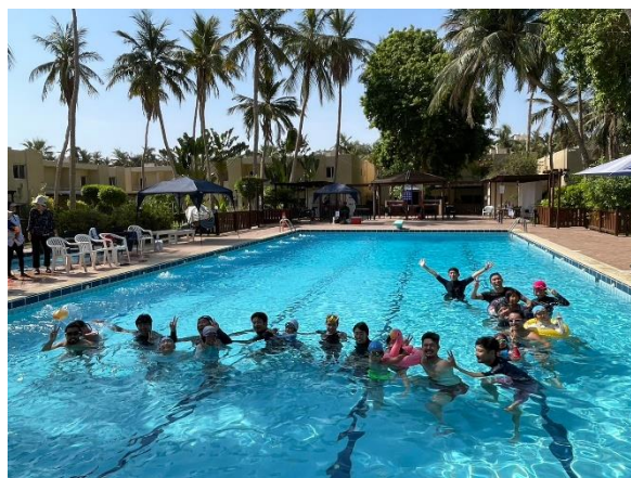
最後は一つ、じゃんけん列車

7日(金)の水泳大会は、子どもたちの笑顔とが んばり、保護者の方々のご協力、日本人会の皆様 のご参加をいただき大変盛り上がり、無事終える ことができました。日本人会総務委員の皆様には、賞 品準備、計時係、会場片付けなど、運営面でもご 協力いただきありがとうございました。当日は、子 どもたちも良い笑顔でした。先日、子どもたち に水泳大会の感想を書いてもらいました。紹介し ます。