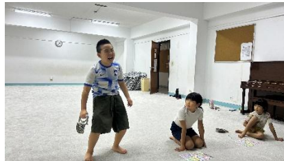
握力測定中集中して力を出します。

昨年度に引き続き、子どもたちの体力の伸びの目安になる「新体力テスト」を実施しています。測定種目は、表のとおりです。以前は1500mの持久走などがありましたが、種目が改訂されています。多くの日本人学校の課題として、体力不足があります。校庭が狭かったり、子どもたちの遊ぶ場所が住んでいるマンションの庭だけなど遊ぶ場所、運動する場所の確保が海外では課題となり、そのため、持久力の向上は課題の一つになっています。持久力は、今回の体力テストでは20mシャトルランが該当種目となります。ジッダでは、水泳ができていた時期はいいですが、水泳がなくなったときの運動量の維持が課題となり、