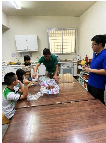
豆まきの豆の袋づめ

のは大変だ」と子どもたちも考えています。「大変だからこそ力になるのです。」豆まき集会が盛り上がるといいですね。