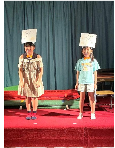
漫才コンビ 節分の2人