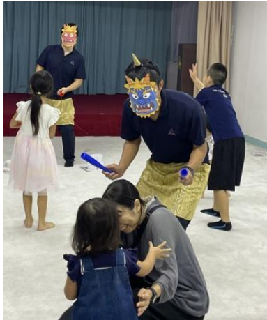
鬼が来たー。 みんなで「鬼は外 福は内。」

在籍人数の少ない日本人学校では、必然児童生徒が活躍する場面が多くなります。先月のコロナボ日本人学校の研究発表でも、児童の行事などの司会をやる機会を多く設定したら、児童から「人前で話すことに緊張しなくなった。」などの発表があり、本校と同じ成果があがっていました。本校でもこの取り組みをさらに続けていきます。 本校の場合は、みんなの前で話すだけでなく、自分の考えを人に伝えるための台詞を