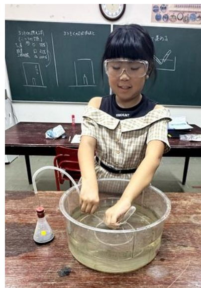
酸素を発生させて試験管に集めます。

日本人学校では教材を日本から届けてもらいますが、薬品等は輸送できないので、現地で調達しています。この現地調達で理科教員の仕事になるのですが、今回は、うまくいきました。このようにして、現地理解を深めていくのですが、ひとまず安心できました。